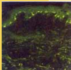
ランゲルハンス細胞