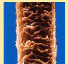
髪(走査電子顕微鏡撮影)