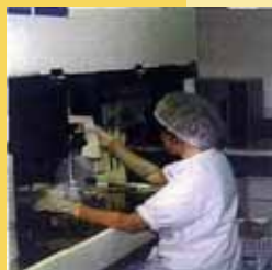
In vitro 試験