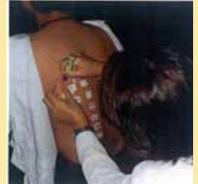
パッチテスト(皮膚)