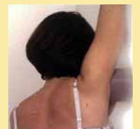
臭気評価(スニッフテスト)